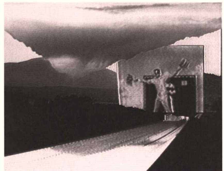
Woody Vasulka, „The Art of Memory: The Legend“

Informationen zum täglichen Videoprogramm auf S. 16