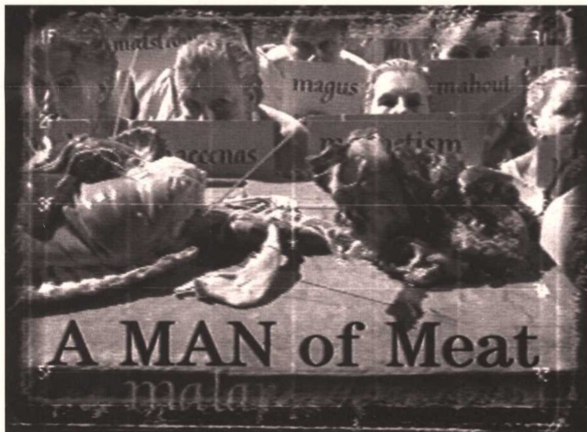
Peter Greenaway, „M is for Man, Music, Mozart“

auch heterogenen Materials gesetzt: Film, Video in allen Formaten, Photo, Erzählung, Kommentar, Inszenierung, Songs. Eigenes und Fremdes verwebt sie zu berührenden Erzählungen (z. B. in „Seeing is Believing“ im täglichen Videoprogramm). Ihr letztes Tagebuch heißt „Recovered Diaries“ und verweist auf die immer wieder drohende Gefahr des Vergessens und Verdrängens. Hershman untersucht hier die Langzeiteffekte von Krieg und Gewalt für Frauen und Kinder. Ihr Vortrag „Preliminary Notes“ innerhalb der Veranstaltung am 14. Mai, ein immer wieder vorläufiges Fazit einer fast dreißigjährigen künstlerischen Arbeit, streift die zentralen Themen Geschlechterdifferenz und Generationenkonflikt, Identitätsverlust und Medienrealität. Hershman gelingt wie wenigen anderen, anhand dieser Themen das Ausmaß deutlich werden zu lassen, in dem das Private Ausdruck des Sozialen ist.