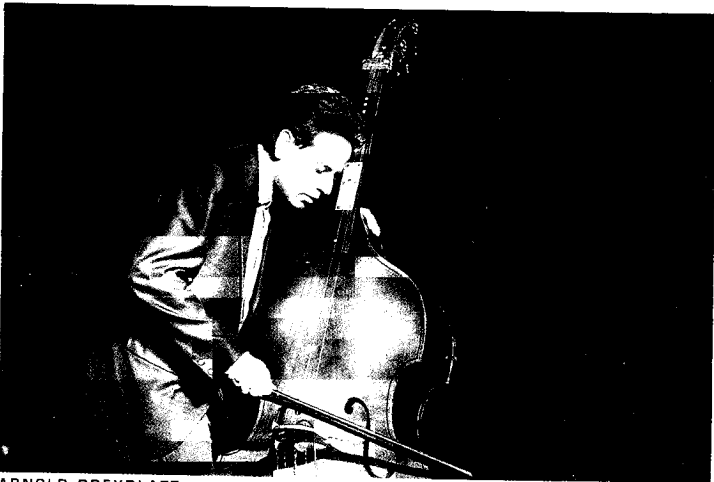
WIENER FEST. FN