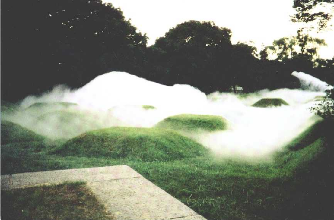
中谷芙二子 □ 霧の彫刻 Fujiko Nakaya □ FOG SCULPTURE