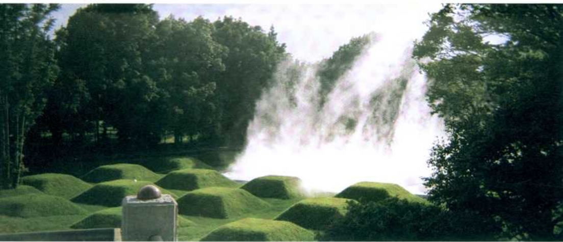
中谷英二子□霧の彫刻 Fujiko Nakaya□FOG SCULPTURE