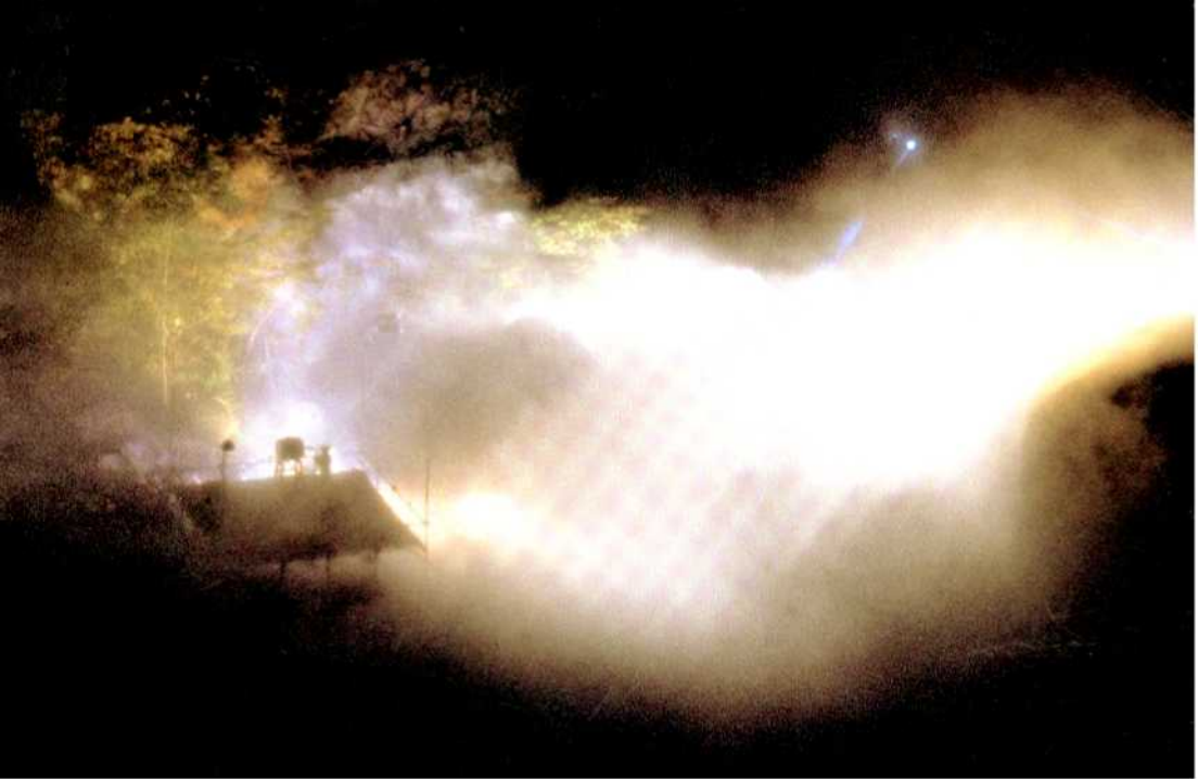
中谷英二子□霧の彫刻 Fujiko Nakaya□FOG SCULPTURE