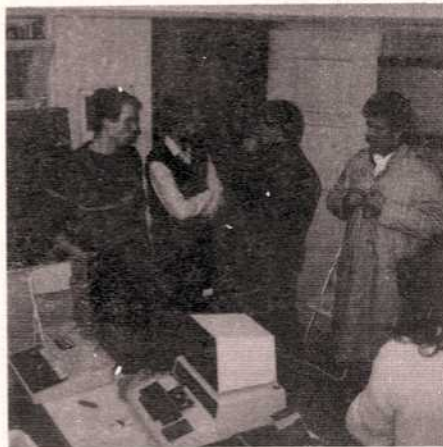
Computer-artists in MonteVideo

De totale 'bemanning' van het voormalige pontpand telt nu 9 medewerkers: part-timers, vrijwilligers, stageaires (studenten) en een directeur.